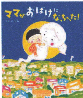
ママがおばけになっちゃた