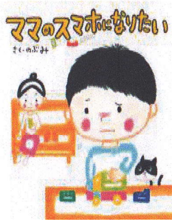
ママのスマホになりたい